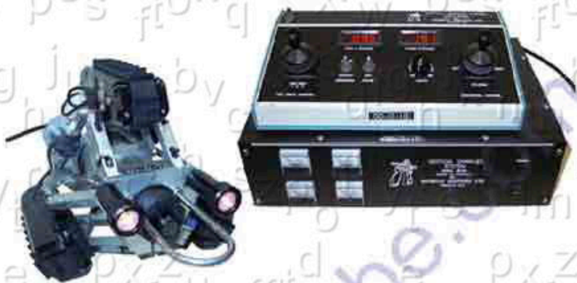
Figura 1, robot teleguidato in grado di percorrere i condotti di condizionamento dell'aria in orizzontale e verticale, superando curve e giunzioni. Può essere dotato di manipolatori e vari utensili per praticare fori e posizionare oggetti.